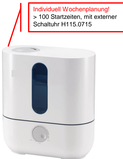
H Hygiene Solution 50-120 (Raumvolumen 50-125 m 3 )

Mit dem H Hygiene 50-120 Gerät in Verbindung mit der gebrauchsfertigen NeuroDes AIR Lösung, kann die Ansteckungsgefahr durch Tröpfcheninfektion in geschlossenen Räumen massiv gesenkt werden. Die Oberflächendesinfektion mit Langzeiteffekt desinfiziert alle Oberflächen im Raum, sodass Sie sich wieder auf die Reinigung konzentrieren können. Das einzigartige Verfahren inaktiviert Viren und Bakterien in der Luft in den Aerosolen - den ganzen Tag.